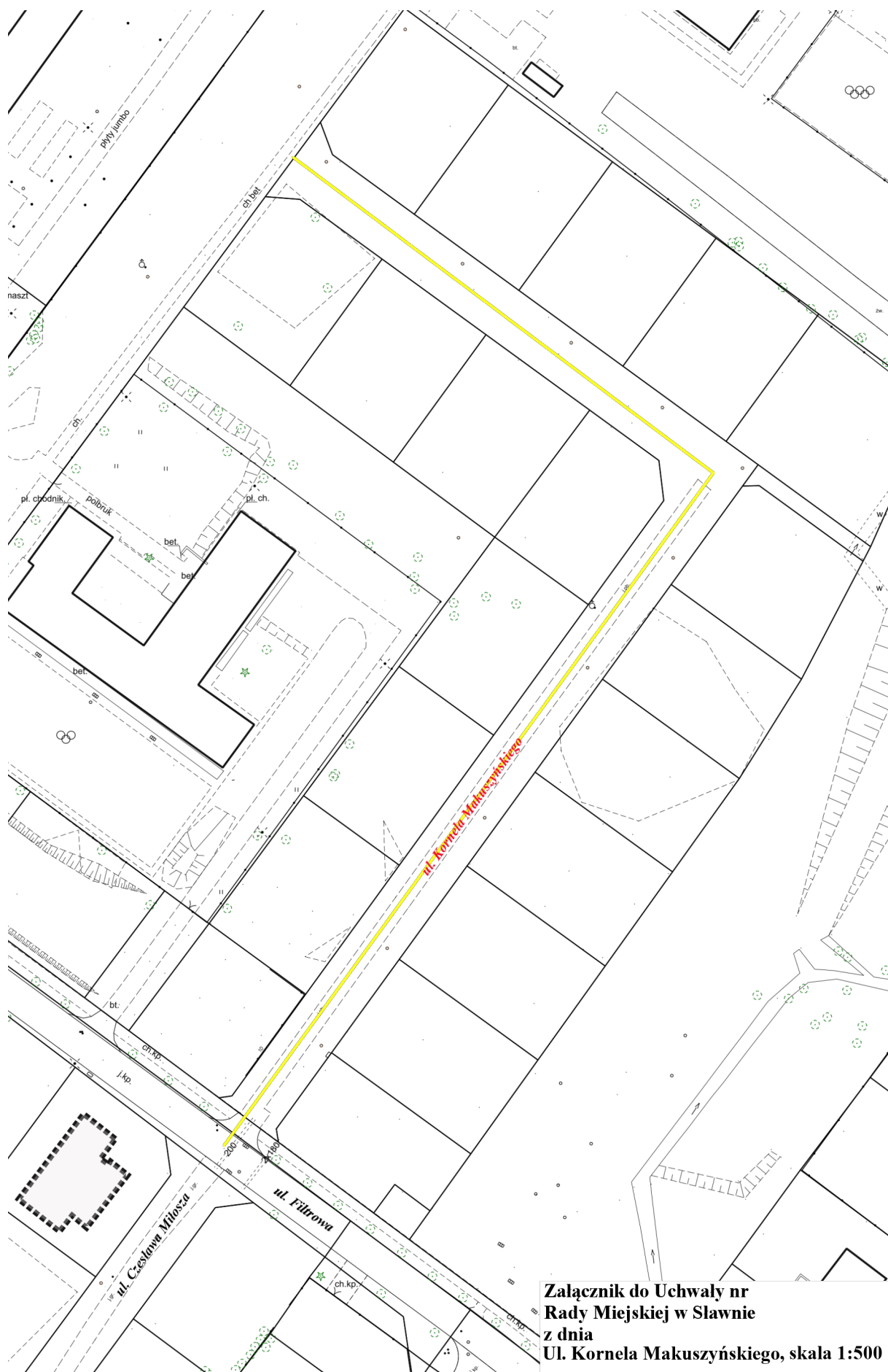
Załącznik do Uchwały nr Rady Miejskiej w Sławnie z dnia Ul. Kornela Makuszyńskiego, skala 1:500