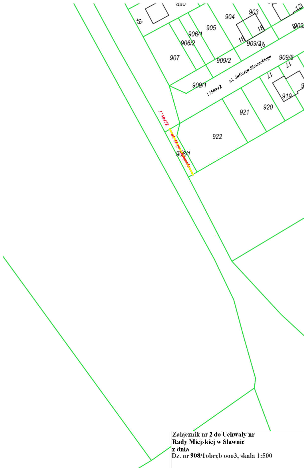
Załącznik nr 2 do Uchwały nr Rady Miejskiej w Sławnie z dnia Dz. nr 908/1obręb 0003, skala 1:500