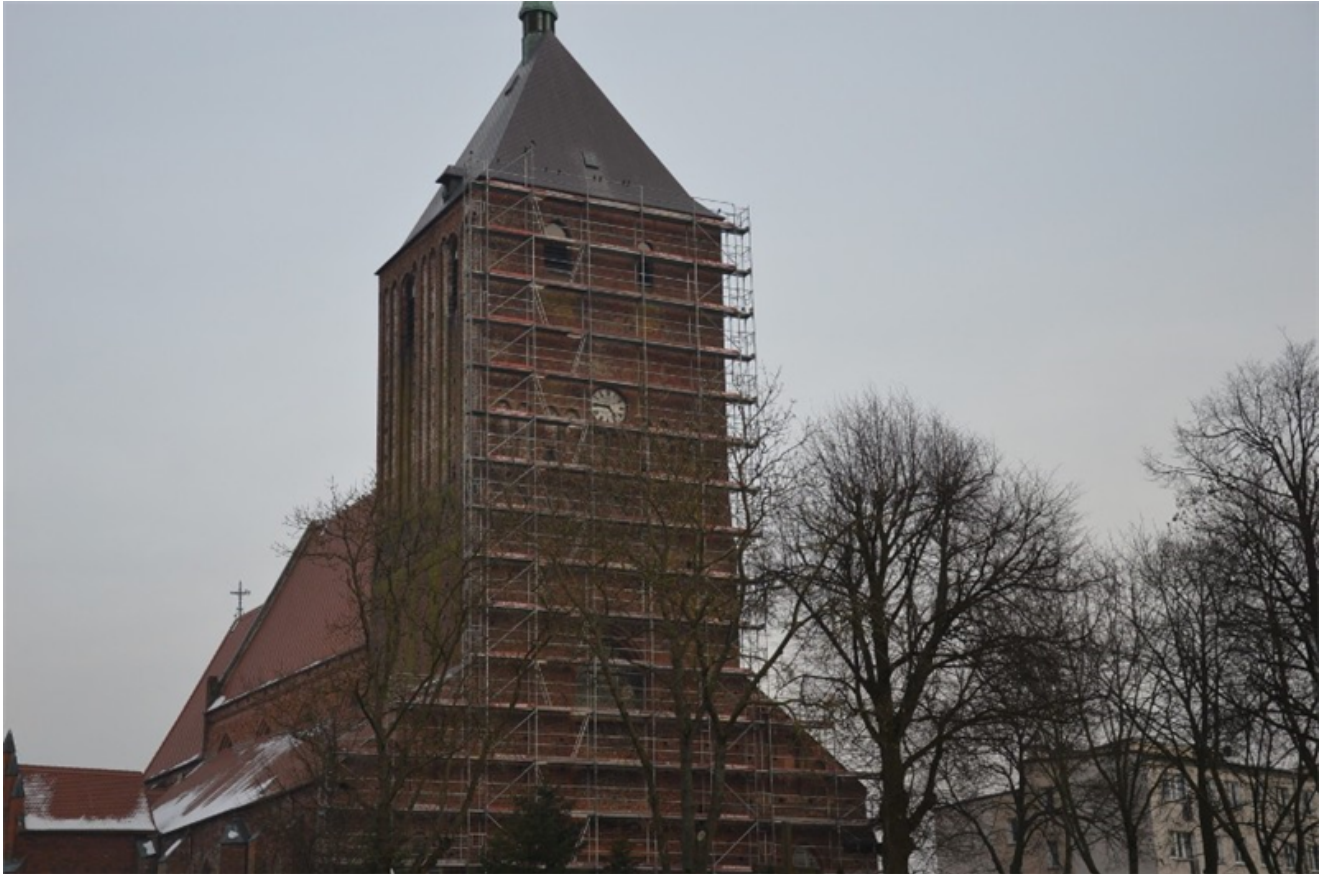
Remont murów zewnętrznych kościoła parafialnego pw. WNMP