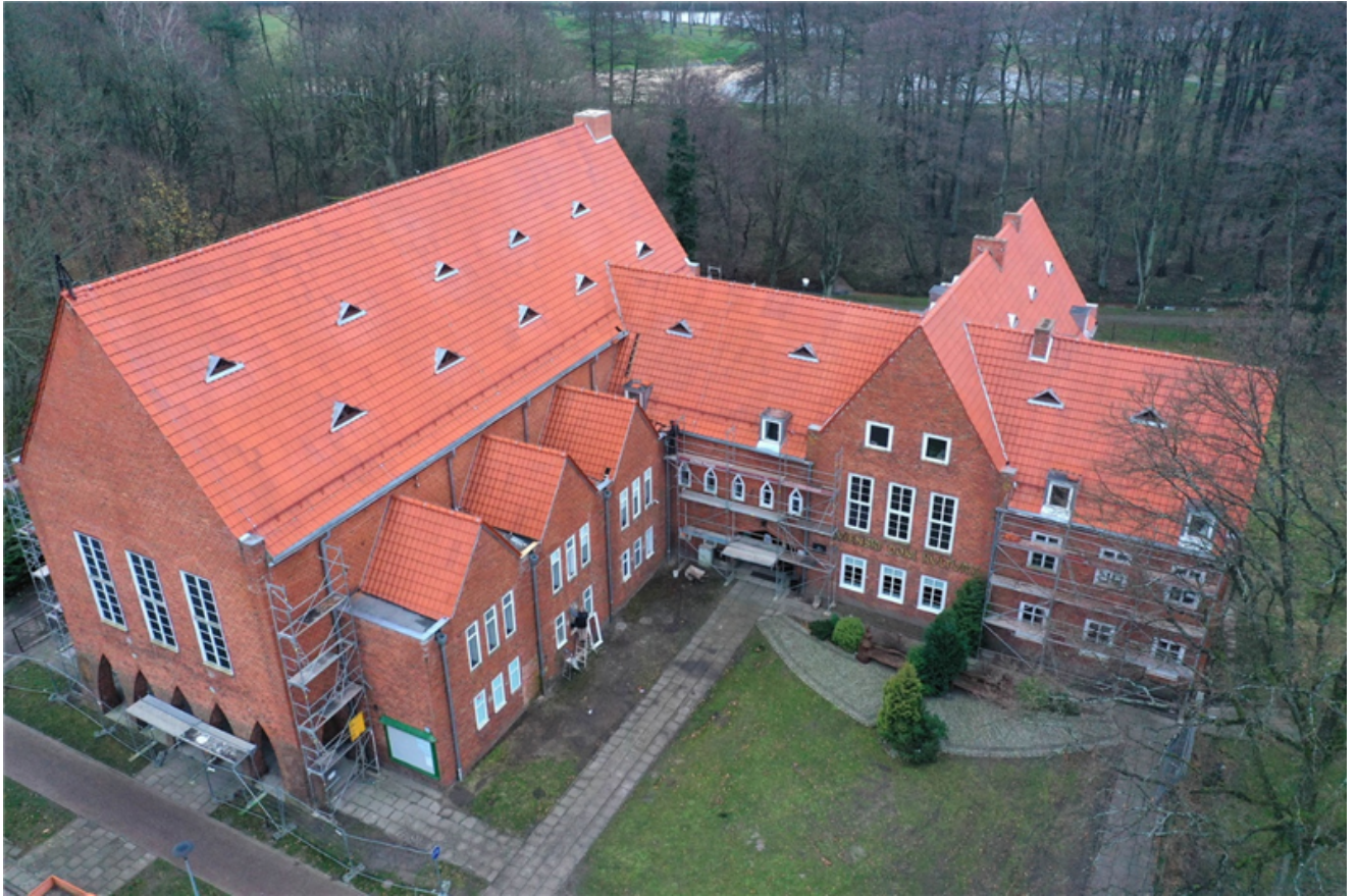
Remont dachu Sławińskiego Domu Kultury