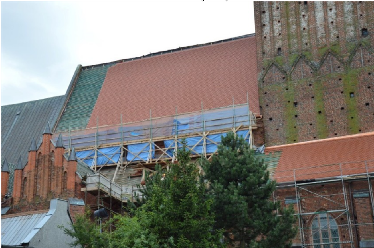
Remont dachu kościoła parafialnego w Sławnie pw. WNMP