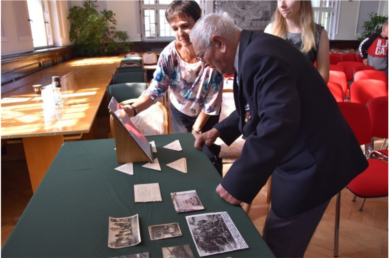
Podsumowanie Zachodniopomorskich Dni Dziedzictwa 2019