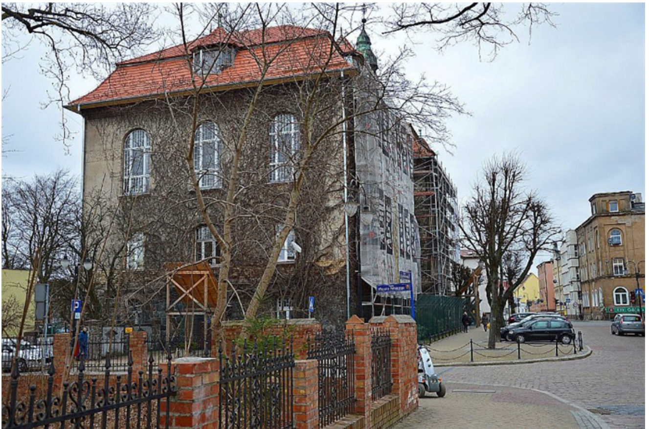
Remont dachu Sławińskiego Ratusza